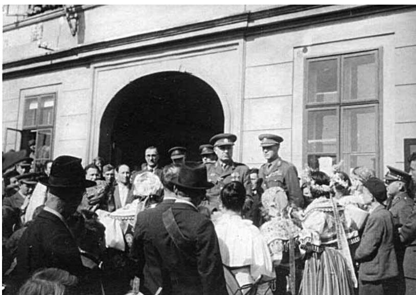
Generál Ludvík Svoboda, čestný občan města Podivína a tehdejší ministr národní obrany, při projevu před starou radnicí.