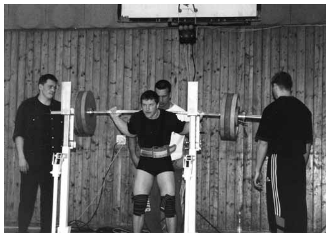
Silový trojboj Podivín (12.2.2005) - otevřené Mistrovství jižní Moravy. Na čince 210 kg.